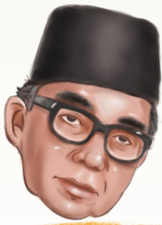
Tun Abdul Razak