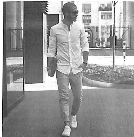
Gambar 2. Penggunaan celana cingkrang dalam dua lensa yang berbeda

https://cdn.idntimes.com/content-images/community/2018/12/photogrid-1544845116570-ad03cb3e4a8cb0a7e388a507cb8ec27d.jpg )