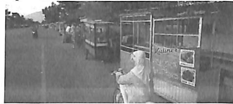
Gambar 1. PKL di sudut Kota Banda Aceh

Dalam perkembangan selanjutnya, pengertian PKL menjadi semakin luas, tidak hanya pedagang yang menempati trotoar atau sepanjang bahu jalan saja. Ruang aktivitas usaha pedagang kaki lima yang semakin luas, dimana tidak hanya menggunakan hampir semua ruang publik yang ada, seperti jalur-jalur pejalan kaki, areal parkir, ruang-ruang terbuka, taman-taman, terminal, perempatan jalan, tetapi juga dalam melakukan aktivitasnya pedagang kaki lima bergerak keliling dari rumah ke rumah melalui jalan-jalan kecil di perkotaan. 95