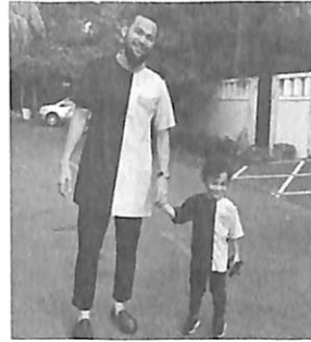
Gambar 1. Penggunaan celana cingkrang dalam dua lensa yang berbeda

Kesamaan gaya cingkrang antara sirwal dengan high water pants tak lantas membuat pakaian syar'i dapat diterima begitu saja. Dalam hal ini, bias penilaian tetap saja muncul dimana celana cingkrang di satu sisi dikatakan sebagai salah satu style dalam fashion , sementara di sisi lain justru diidentikkan dengan radikalisme dan hal-hal menakutkan lainnya. Seperti yang terlihat pada gambar di bawah ini.