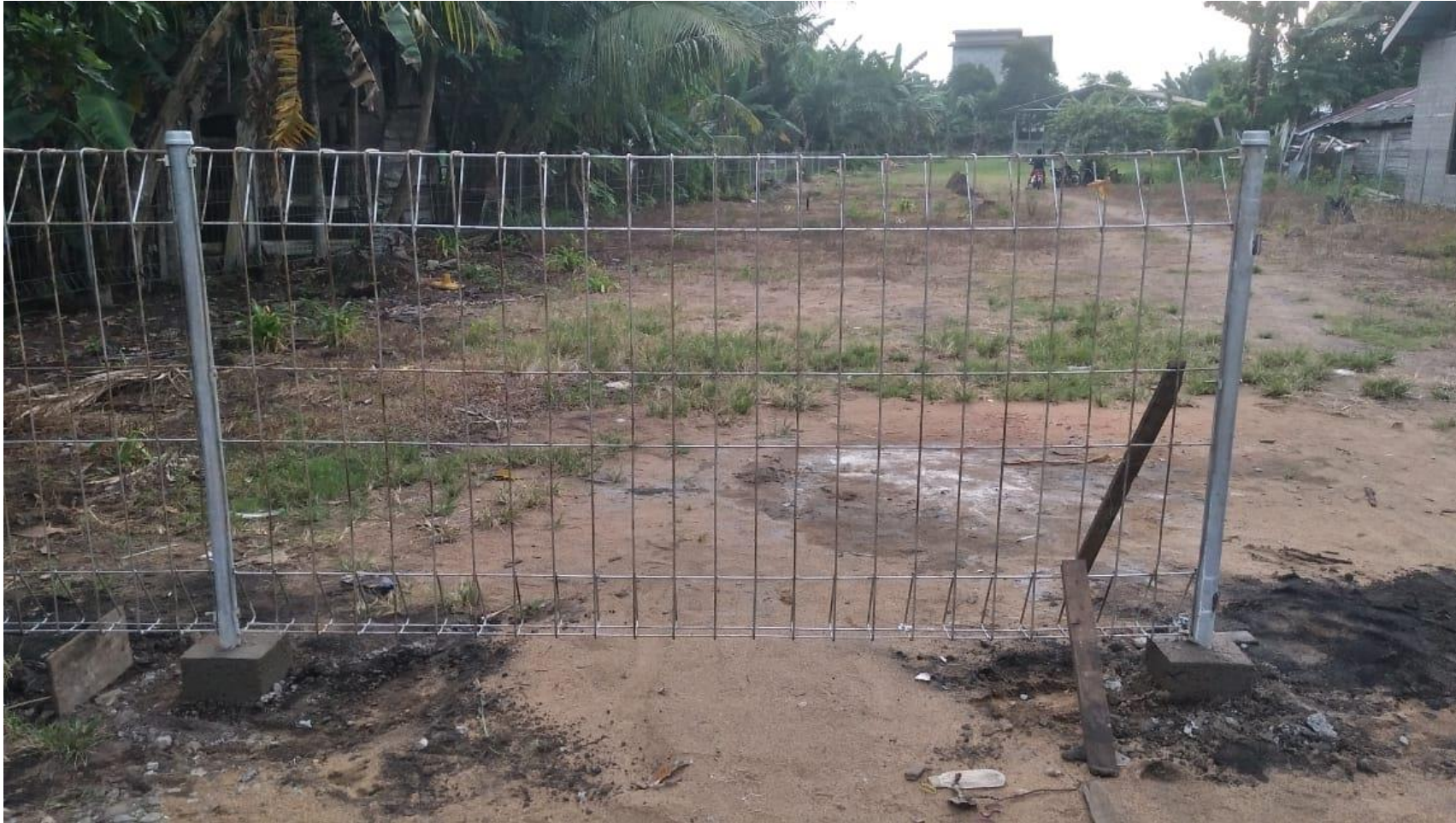
Foto 5. Pagar BRC Pada Sisi Timur