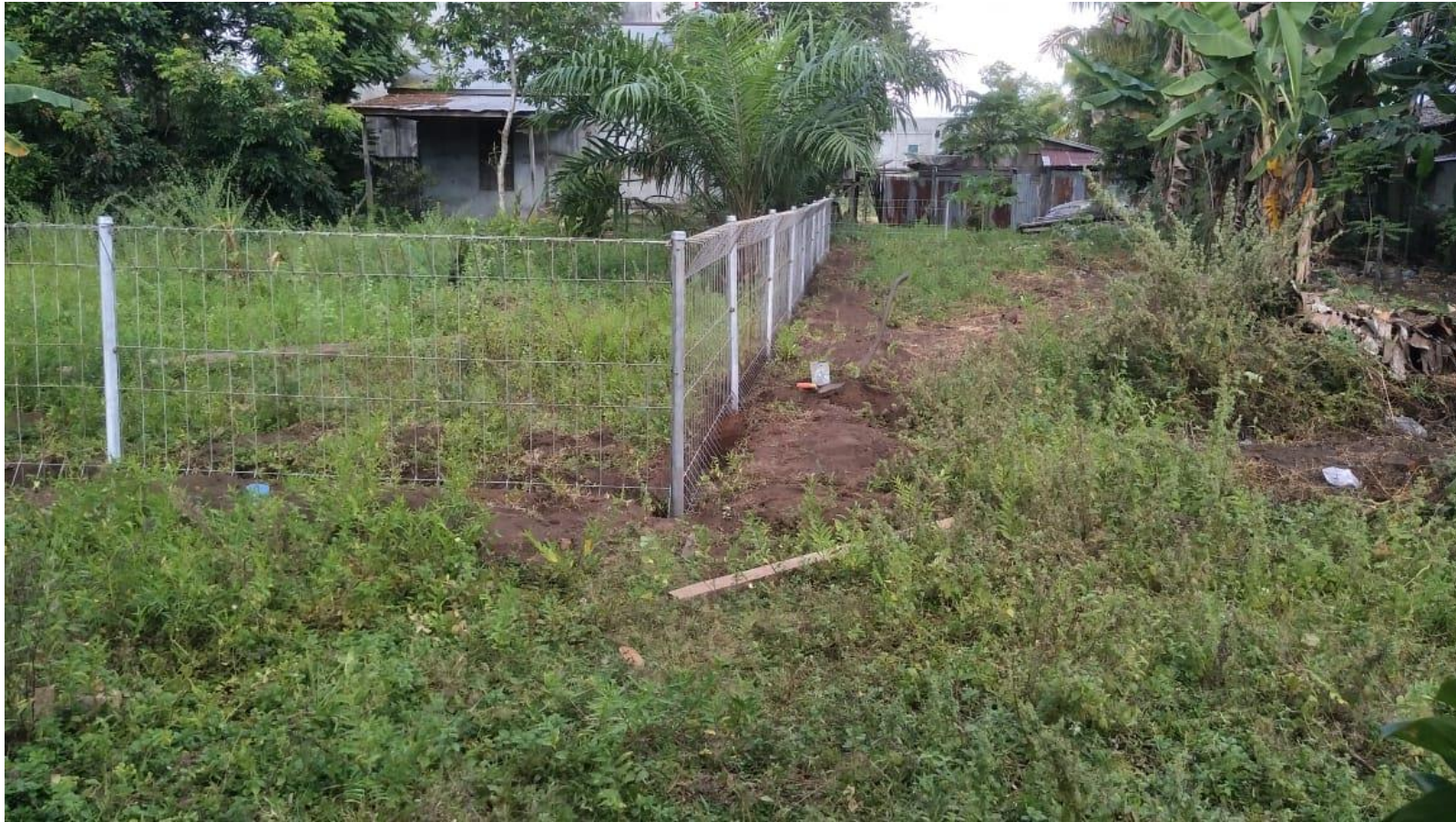
Foto 3. Pagar BRC Pada Sisi Barat Daya