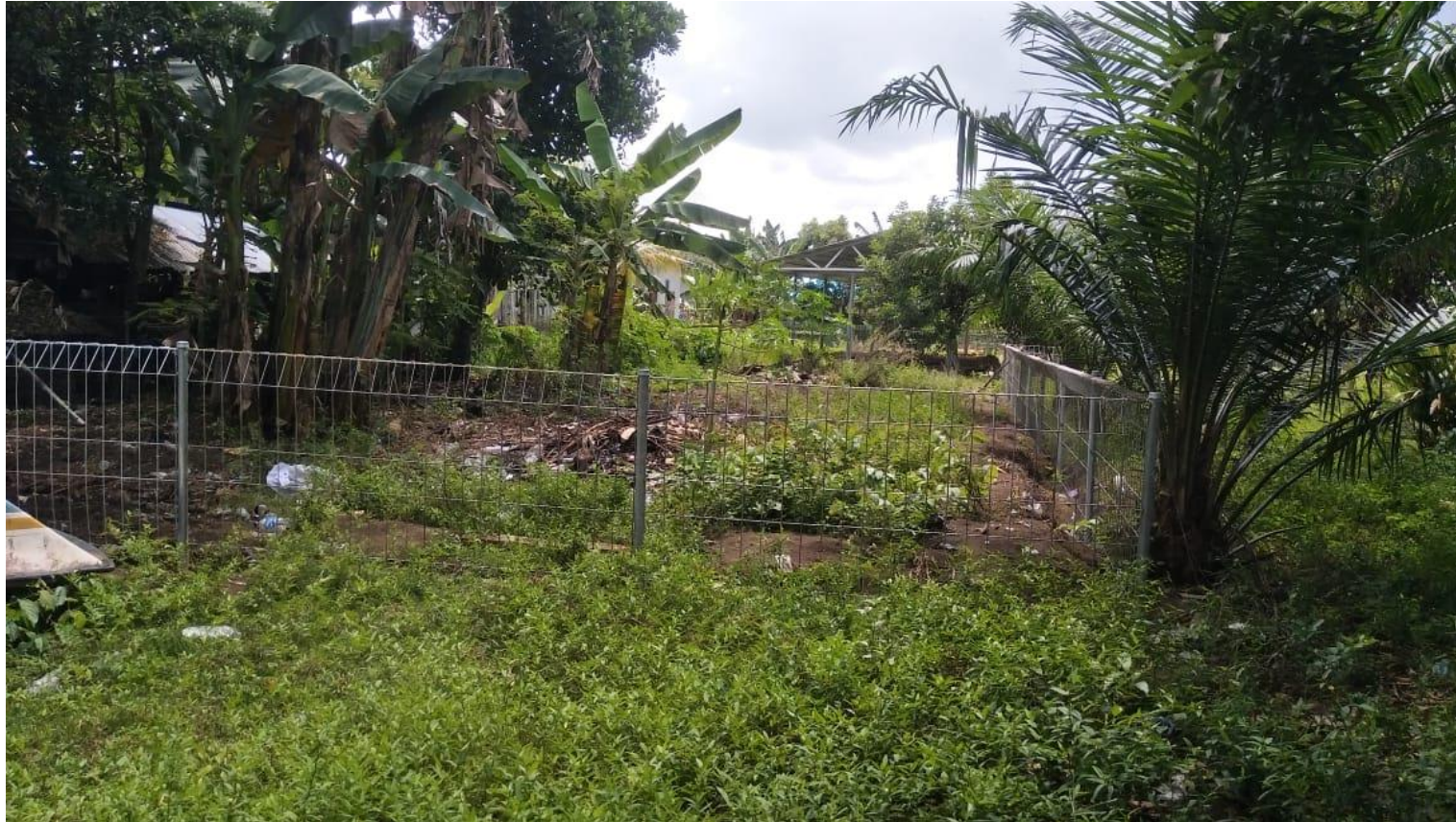
Foto 6. Pagar BRC Pada Sisi Selatan