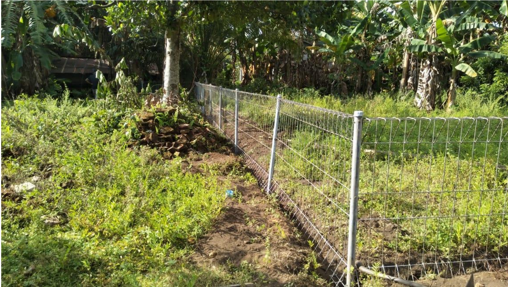
Foto 4. Pagar BRC Pada Sisi Barat Daya