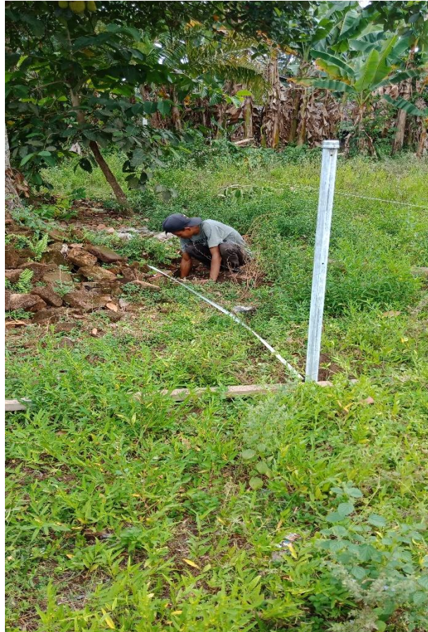
Foto 2. Pekerjaan Galian Tanah Pondasi