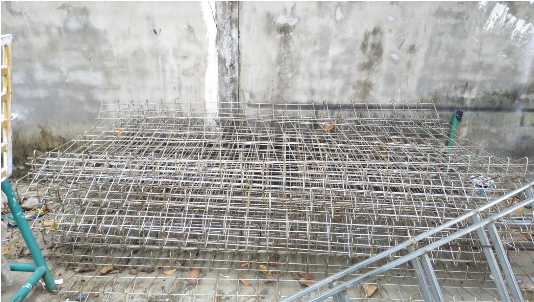
Foto 1. Pagar BRC yang akan dipasang